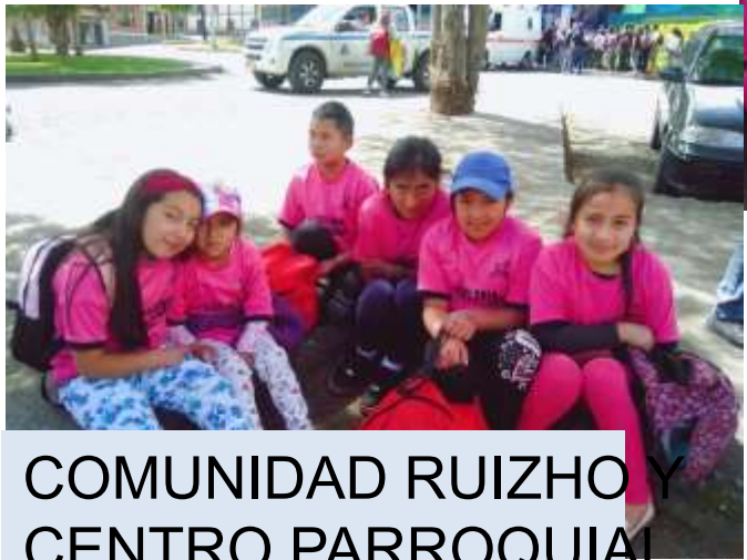
COMUNIDAD RUIZHO Y CENTRO PARROQUIAL