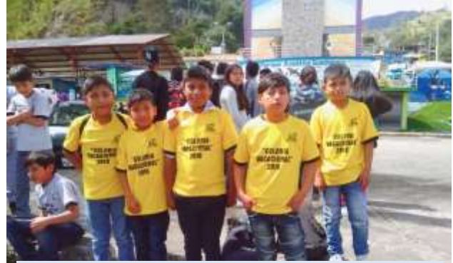
COMUNIDAD DE TAGUA