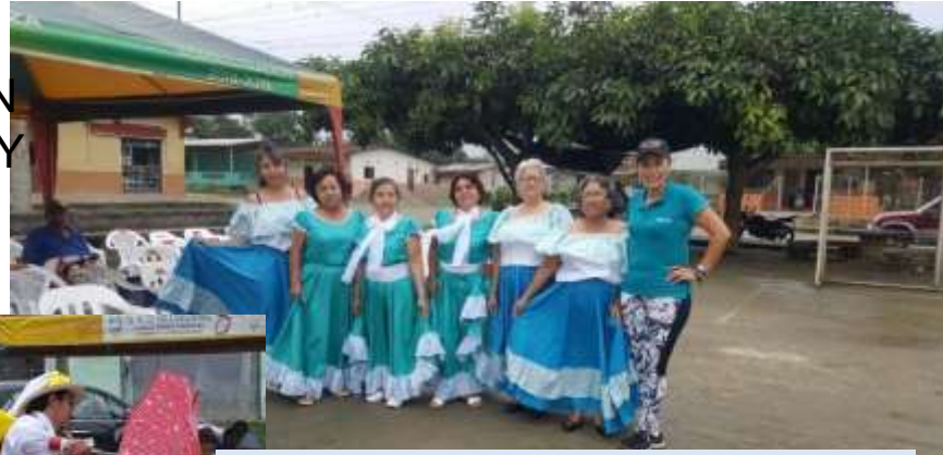
INTERCAMBIO DE CULTURAS MEDIANTE EL BAILE DE DANSA

PERSONAS CON DISCAPACIDAD Y ADULTOS MAYORES