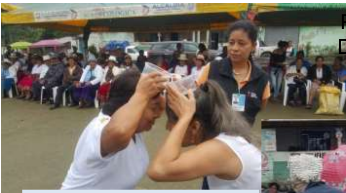
JUEGOS Y CONCURSOS

INTERCAMBIO DE EXPERIENCIAS ENTRES DOS CANTONES HERMANOS (SIGSIG – PONCE ENRIQUEZ)