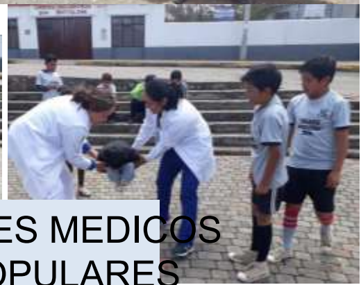
ACTIVIDADES MEDICOS JUEGOS POPULARES